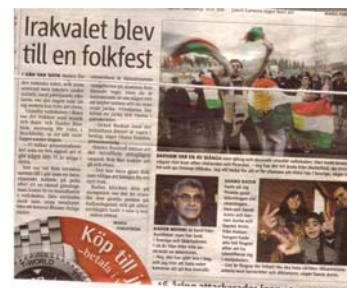
Metro – fredag 16 december-2005