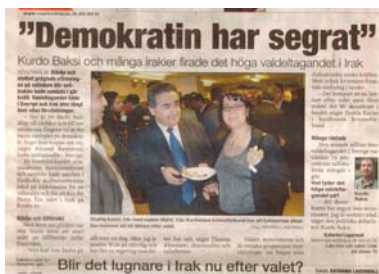
Stockholm City * Måndag 31 januari 2005